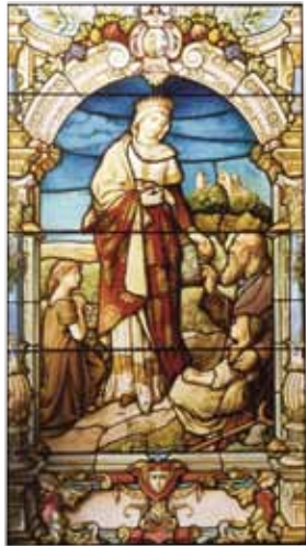
„Musivische Glasmalerei“, Sign. „Gertrud von Schimmelmann“, 1907 Darstellung der hl. Elisabeth vor der Wartburg, 100 x 205 cm

Die ausgestellten Mosaikfenster stammen überwiegend aus bürgerlichen Privathäusern und fanden besonders in der Zeit des Jugendstils eine große Verbreitung.