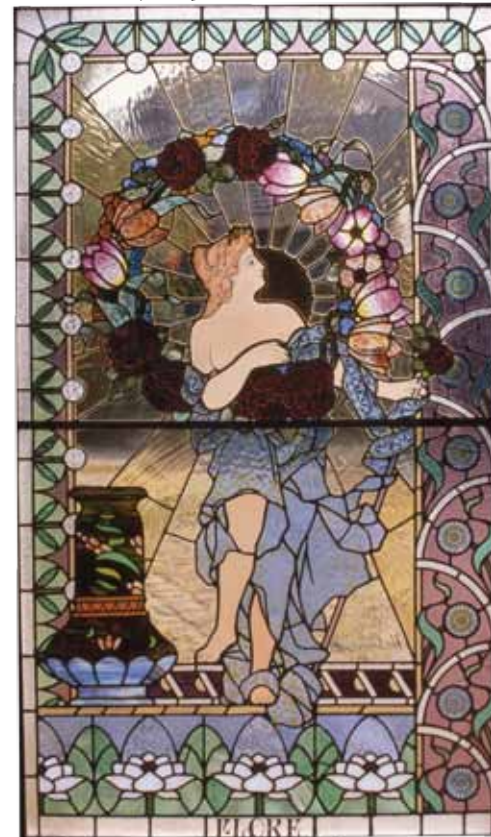
Blumengöttin „Flore“, Musivische Glasmalerei, Blei, Frankreich um 1900, 115 x 200cm